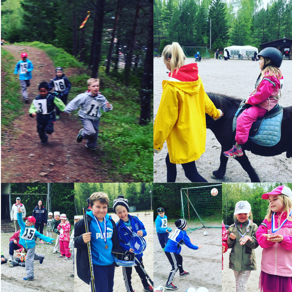
Kooste kevätriehasta

Kuvia riehasta voit katsella Facebookissa - katso kokoelma-1 ja kokoelma-2 .