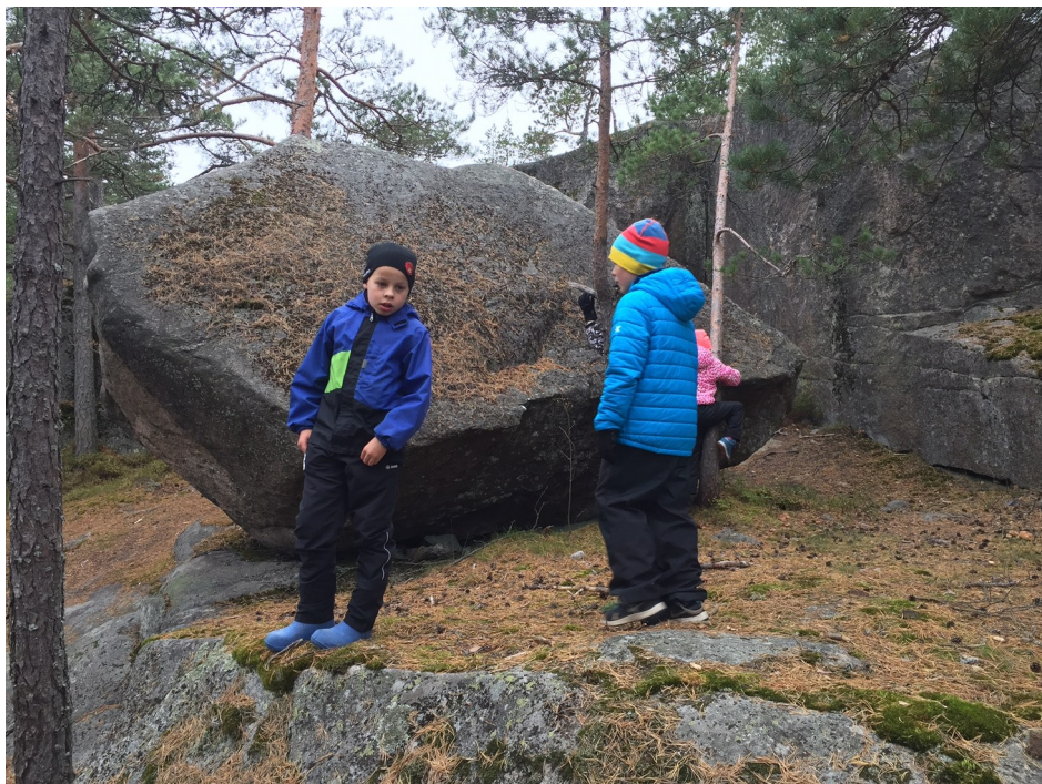
Lasten retki Palokallion lohkkareikossa

Loput sydänretkeläisistä jäivät nauttimaan grillimakkarasta, kahvista ja muista herkuista kodalle. Kaiken kaikkiaan tilaisuuteen osallistui 40-50 ihmistä.