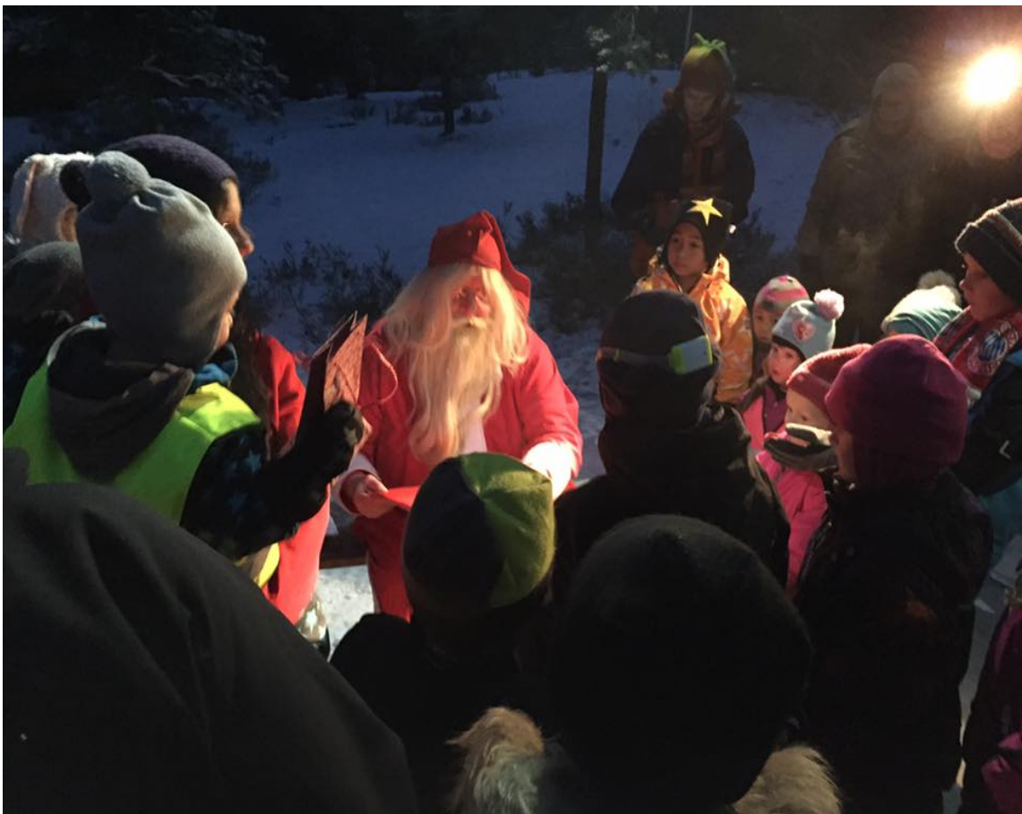
Joulupukki ja lapset

Lopuksi kaikki kerääntyivät laulamaan tuttuja joululauluja joulupukin ympärillä.