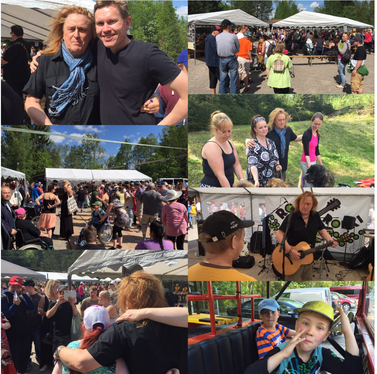
Rokkarokin meininkiä